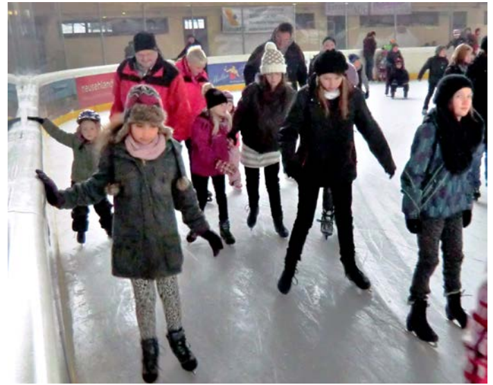
Erste Versuche der Gerteröder auf ungewohntem Untergrund

Bei der Jugendarbeit dürfen Abwechslung und Spaß nicht zu kurz kommen. Die Wanderfreunde aus Gerterode praktizierten das im Januar auf dem Eis. 13 Kinder und 11 Erwachsene trafen sich im Eisstadion in Lauterbach. Nach dem Empfang der ausgeliehenen Schlittschuhe betraten die großen und kleinen Schlittschuhläufer vorsichtig, aber hochmotiviert die Eisbahn. Nach zweieinhalbstündigem "Dauerüben" und nur kurzen Erholungspausen mit heißen Getränken und Snacks konnte sich das Resultat der Großen und Kleinen sehen lassen. Die Teilnehmer, einige standen zum ersten Mal mit Schlittschuhen auf dem Eis, erlebten einen schönen sportlichen und lustigen Nachmittag auf der Eisbahn. Zum Abschluss wurde noch bei Mac Donalds eingekauft, um die verbrauchten Kalorien wieder aufzufüllen.