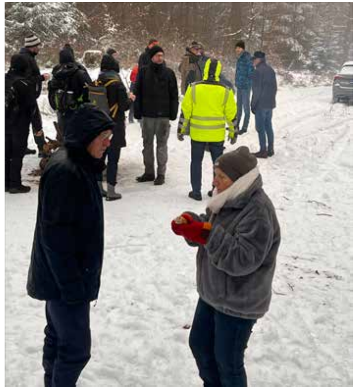
Neujahrswanderung zum Predigerstuhl

Vielen Dank an die Wandergruppen aus Grebenhagen, Appenfeld, Wallenstein, Raboldshausen für die rege Teilnahme und Euren Besuch.