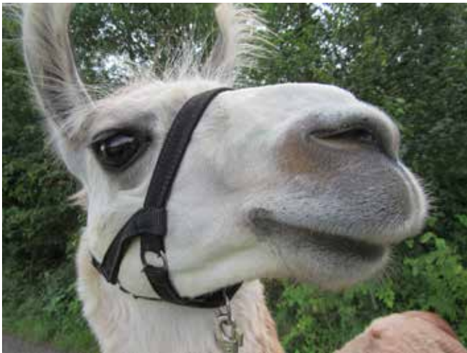
Mit Lamas zehn Tage durch die Rhön

Gerne möchten wir im Landesverband davon berichten, was uns das letzte Jahr begleitet hat und mit welcher Motivation und mit welchen Aktionen wir in 2025 optimistisch nach vorne blicken. Starten wir mit unseren Veranstaltungen. Unser Dauerbrenner das Trekkingwandern mit Jugendlichen und einer Handvoll Lamas zehn Tage lang durch die Rhön ist auch im 21. Durchlauf super angenommen worden und bestärkt weiterhin den Wert von tierpädagogischen Angeboten. Anschließend daran haben wir es mit zwei neuen Angeboten geschafft, Jugendliche und junge Erwachsene ab 14 Jahren, welche wir bislang nicht sonderlich gut erreicht haben, abzuholen und im besten Fall auch in Zukunft mit attraktiven Angeboten an die Wanderjugend heranzuführen bzw. auch über das Kindesalter in unseren Kreisen zu halten.