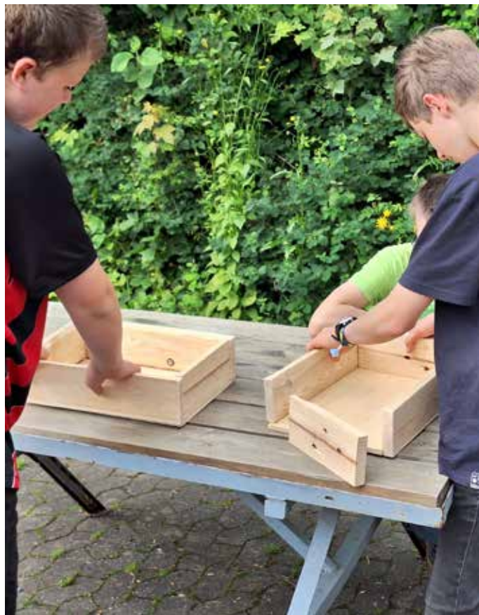
In der Kreativwerkstatt entstehen Möbel und Kunstwerke aus den unterschiedlichsten Materialien

Meldet euch bei Interesse gerne bei info@wanderjugend-hessen.de . Wir freuen uns auf alle gemeinsamen Begegnungen, Kooperationen und Gespräche mit euch in 2025. Weitere Informationen zu unseren Veranstaltungen findet ihr auf https://wanderjugend-hessen.de/wanderjugend-hessen/mitmachen/veranstaltungen