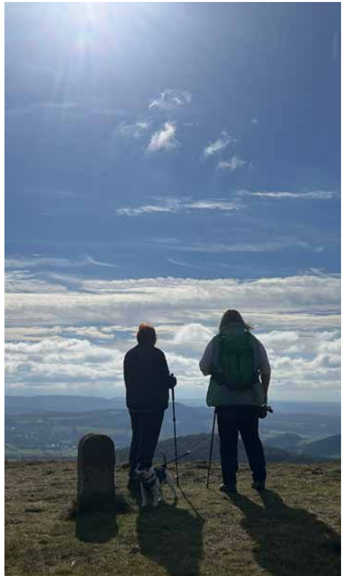
Wanderungen zur Eröffnung des Wanderjahres. Bleibt aktiv!

Wir freuen uns für die nächste Ausgabe des Knüllgebirgsboten auf weitere Wander- und Mountainbike Termine aus den Zweigvereinen.