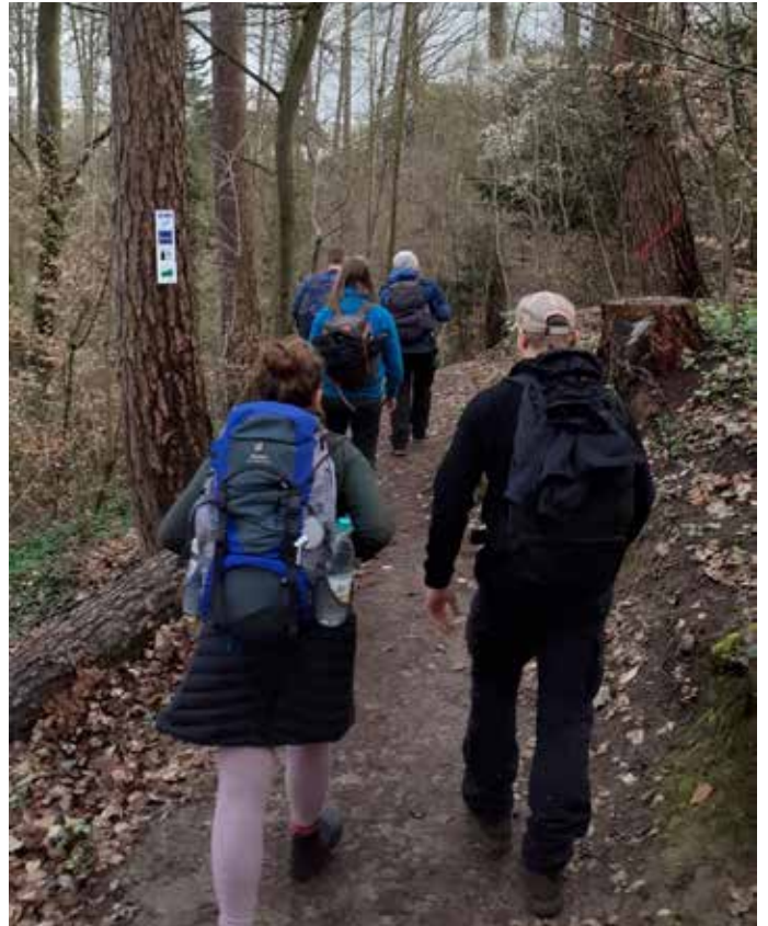
Jugendliche bei der Sportnachtwanderung „Frostbeule“ im vergangenen Jahr. In diesem Jahr als „Rhön by Night“ im Programm

Die zweite Aktion die mit viel Vorlauf - dafür aber umso mehr - gefruchtet hat, war die Kreativwerkstatt, welche gemeinsam mit der DWJ im Rhönklub umgesetzt wurde und alle Bastelbegeisterten und interessierten Handwerker*innen im Jugend- und jungen Erwachsenenalter abgeholt hat.